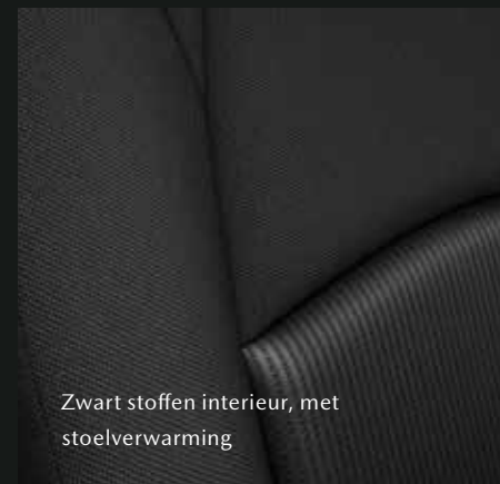
Zwart stoffen interieur, met stoelverwarming