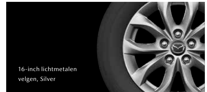
16-inch lichtmetalen velgen, Silver