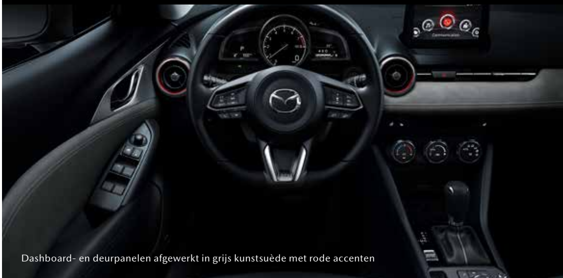
Dashboard- en deurpanelen afgewerkt in grijs kunstsuède met rode accenten