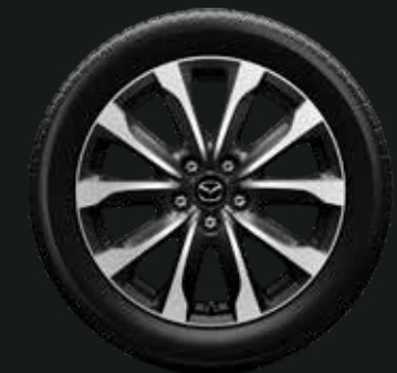
18-inch lichtmetalen velgen, Gun Metal