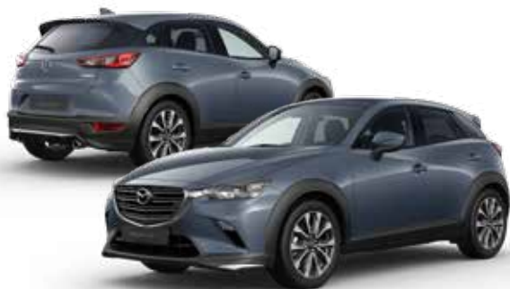
Mazda CX-3 met Sport Pakket

SPORT PAKKET Geschikt voor alle Mazda CX-3-uitvoeringen