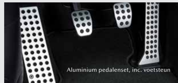
Aluminium pedalenet, incl. voetsteun