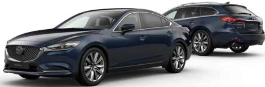
DEEP CRYSTAL BLUE MICA