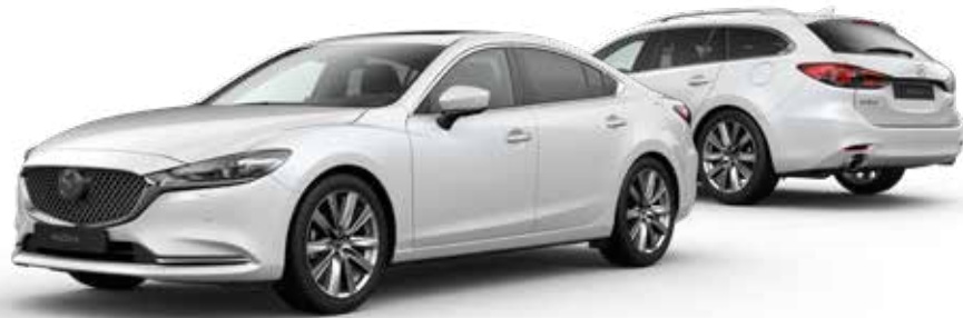
SNOWFLAKE WHITE PEARL