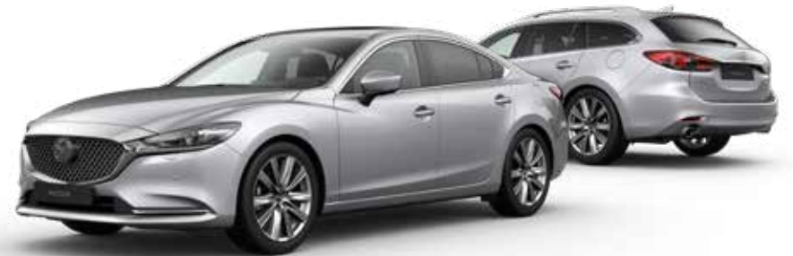
SONIC SILVER METALLIC