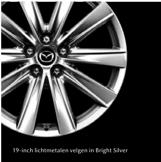
19-inch lichtmetalen velgen in Bright Silver