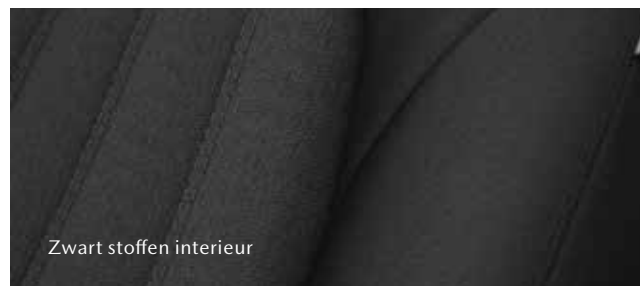
Zwart stoffen interieur