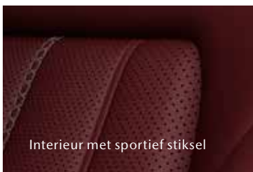
Interieur met sportief stiksel