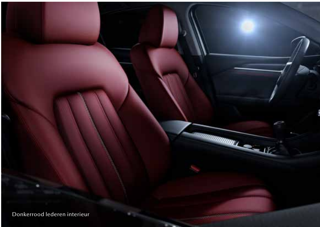
Donkerrood lederen interieur