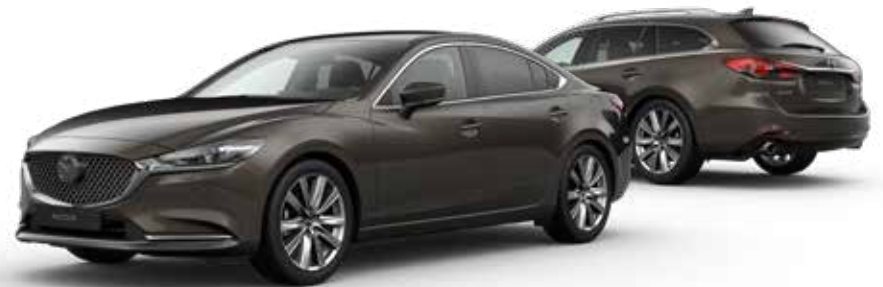
TITANIUM FLASH MICA