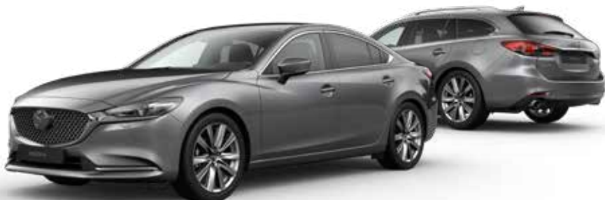
MACHINE GRAY METALLIC