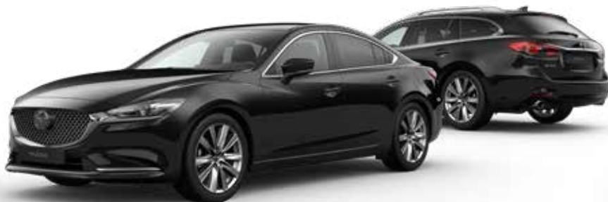
JET BLACK MICA

Je hebt de keuze uit tien kleuren. Arctic White Solid vormt de basis. Machine Gray Metallic en Soul Red Crystal Metallic zijn het meest exclusief. Een speciale laktechniek met nog kleinere en heldere aluminiumdeeltjes zorgt voor een ongekend diepe, heldere kleur.