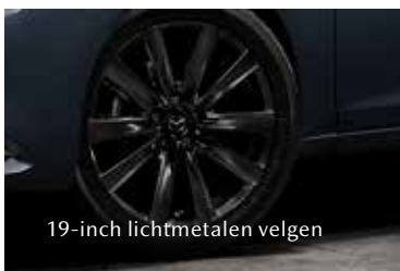
19-inch lichtmetalen velgen