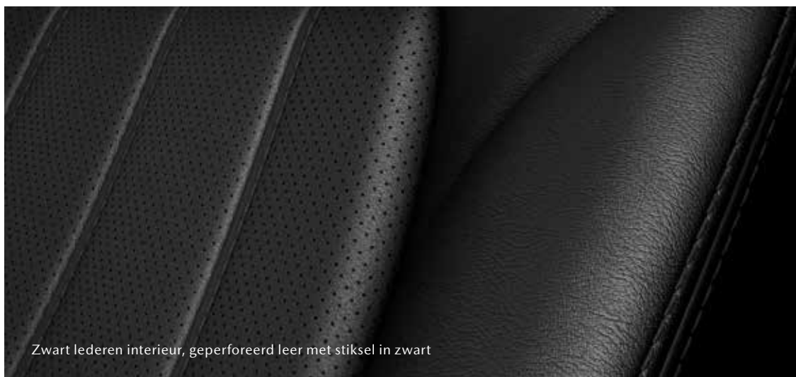
Zwart lederen interieur, geperforeerd leer met stiksel in zwart