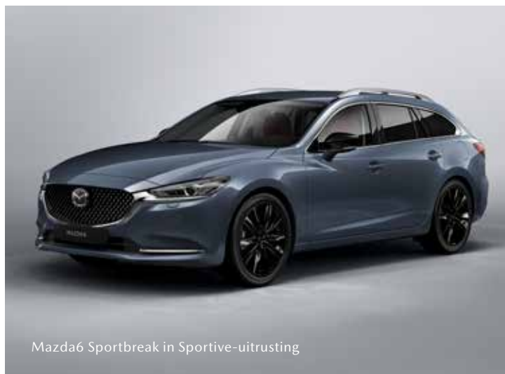
Mazda6 Sportbreak in Sportive-uitrusting