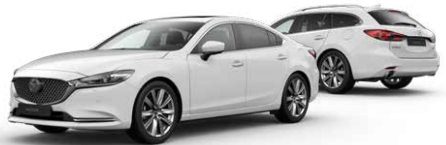
ARCTIC WHITE SOLID

Bekijk de Mazda6 Sportbreak in 360 graden