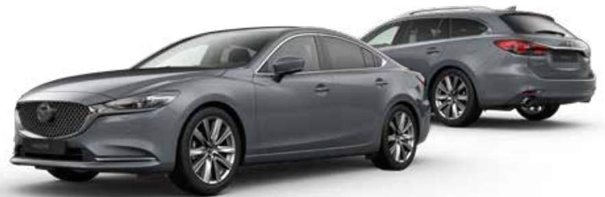
POLYMETAL GRAY METALLIC