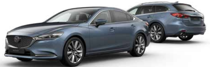
BLUE REFLEX MICA