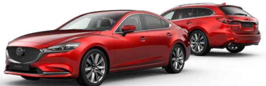
SOUL RED CRYSTAL METALLIC