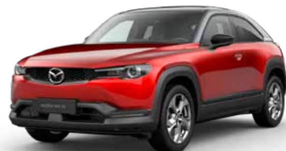
SOUL RED CRYSTAL METALLIC 3-TONE