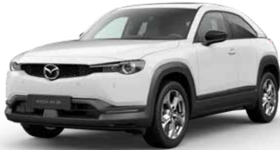
ARCTIC WHITE SOLID