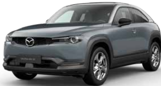
POLYMETAL GRAY METALLIC 3-TONE