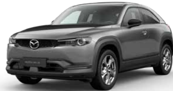
MACHINE GRAY METALLIC